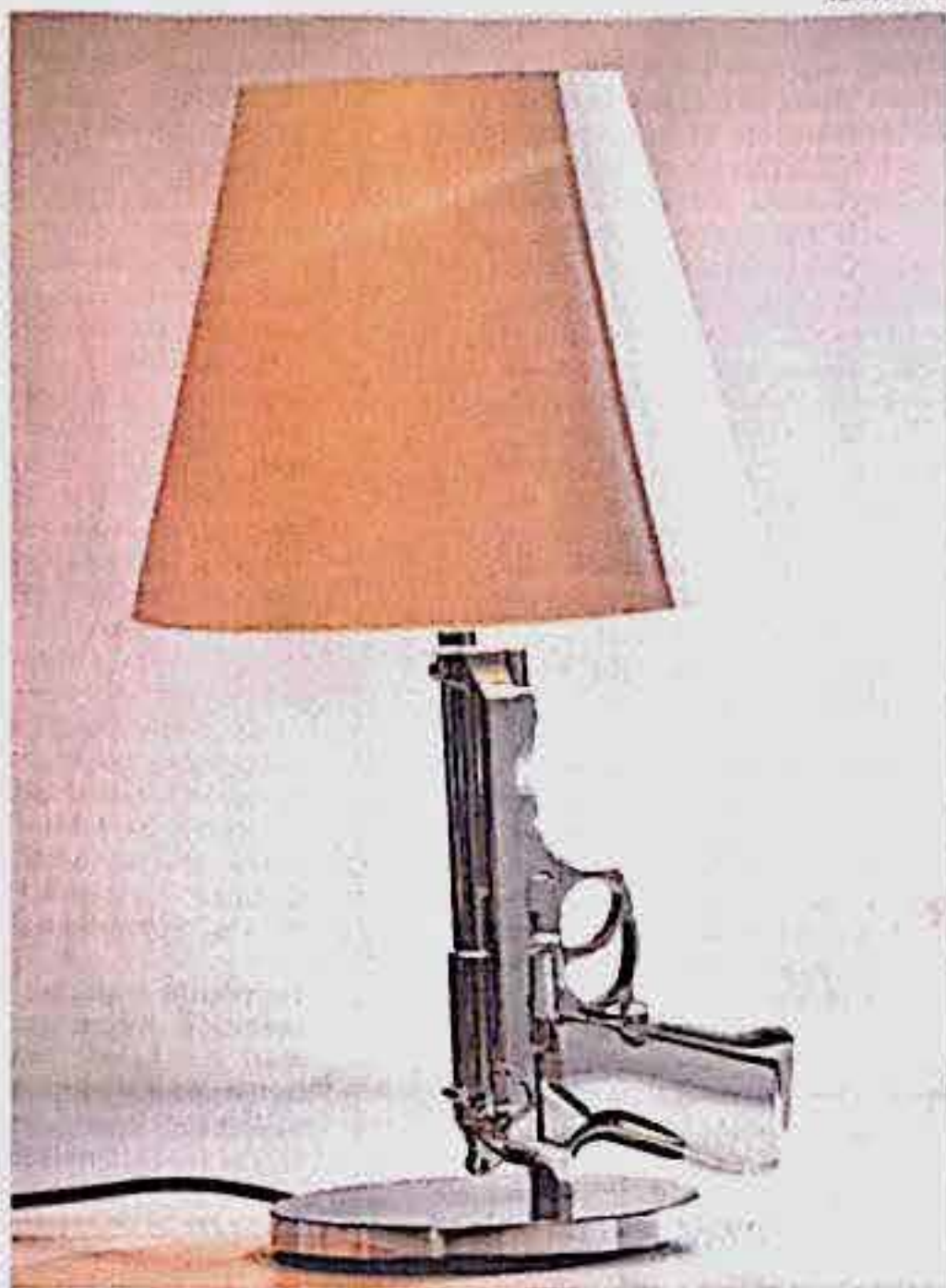
Philippe Starck: Gun Range -lamppu.

Toivottavasti se lievittää jollain tavalla yhä vähemmän israeliläi-