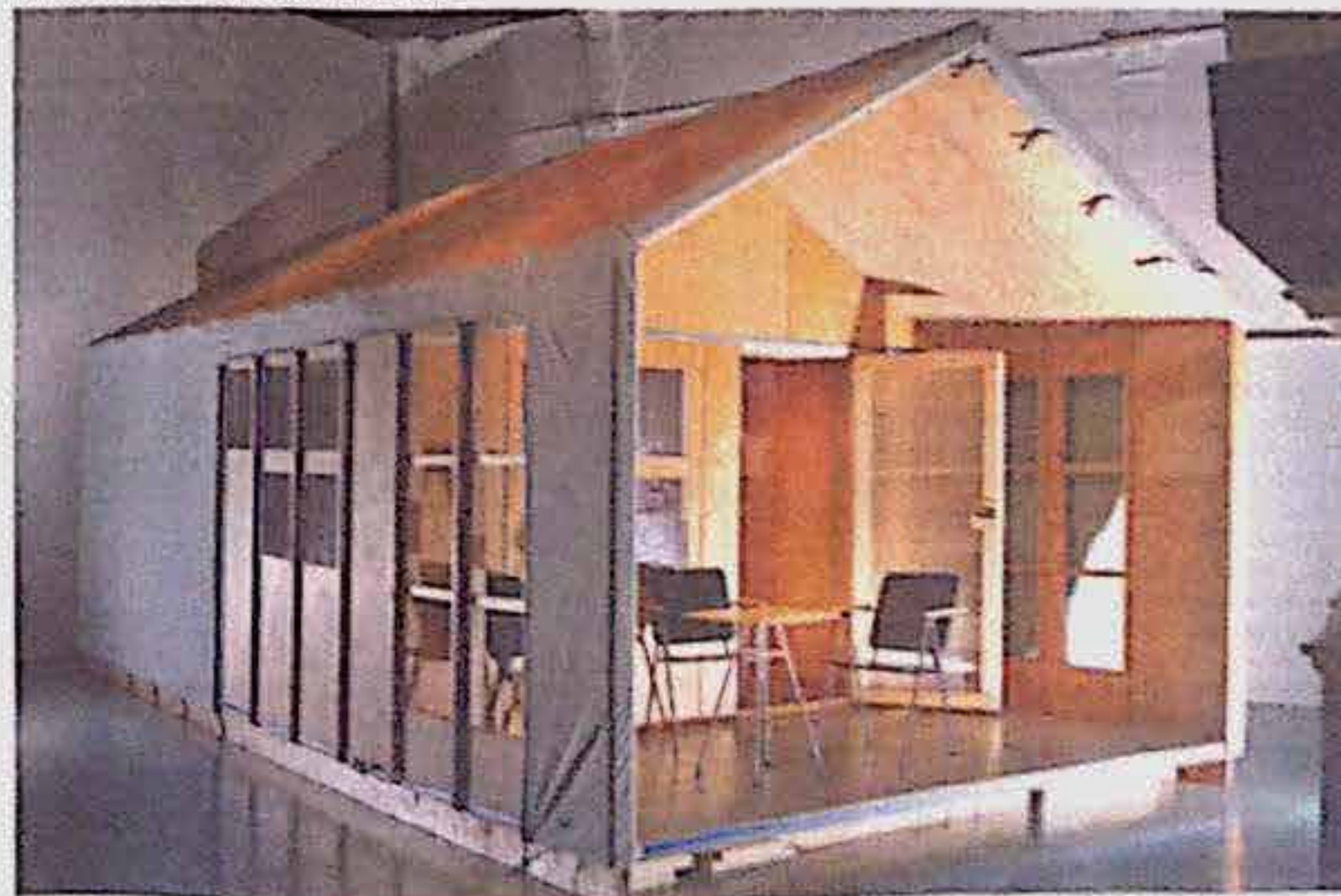
Aalto-yliopiston puustudio suunnitteli helposti kriisiläheille pystytettävän LINA-hätsäsuojan.