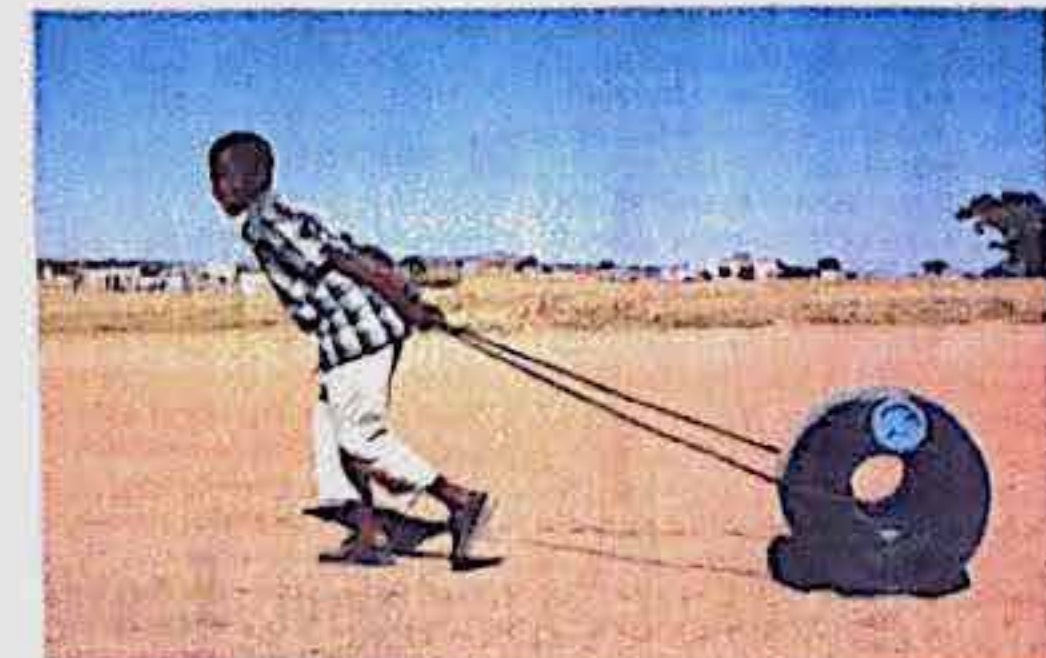
Piet Hendrikse: Q Drum, pyörivä vedenkuljetusastia, 1996.